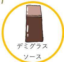
デミグラス ソース