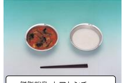
脱脂粉乳 トマトシチュー