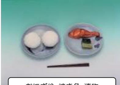
おにぎり 焼き魚 漬物