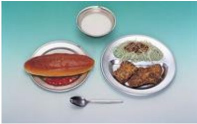
コッペパン ジャム ミルク 鯨肉の竜田揚げ せんキャベツ