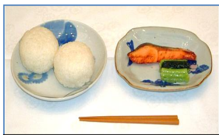
当時の給食を再現したもの

昭和20～40年ころのまだ豚肉や鶏肉の値段が高かった時代、低カロリーでたんぱく質・ビタミン・ミネラルがたくさん入ったくじらは、大事な栄養源としてよく給食に出ていました。今ではあまり見かけなくなりましたが、今月の給食に登場します。楽しみにしてくださいね。