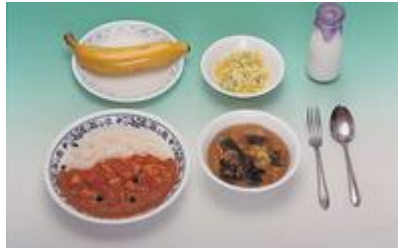
カレーライス 牛乳 塩もみ スープ 果物(バナナ)