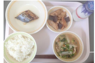
ご飯 牛乳 鯖の塩焼き みそ汁 ちくわの炒め物

現在では栄養バランスがよく献立の種類も増えました。感謝して残さずに食べましょう。