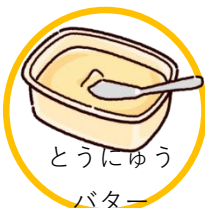
とうにゅう バター